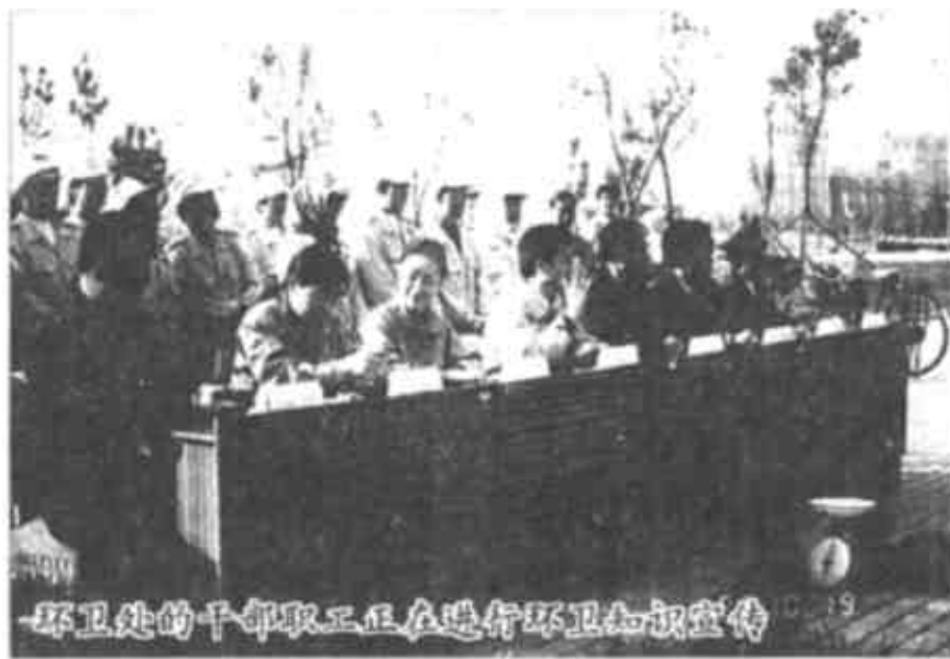
环卫战的千部职工在举行环卫知识宣传

今年6月24日,中共中央总书记江泽民视察东营市政建设后,感慨地说,东营市令我流连忘返,对东营市城市建设与管理给予了高度评价。东营市政建设的成绩