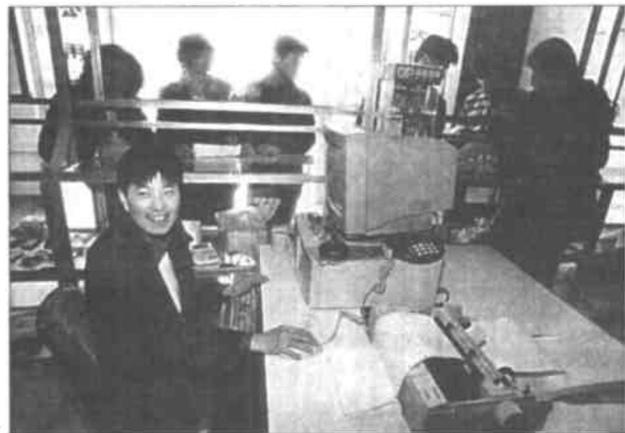
东营区冬枣种植任务落实到实处

认识到位 组织得力 行动迅速 东营区冬枣种植任务落实到实处 本报东营讯 东营区委、区政府把搞好冬枣种植当成农民增收的新兴产业，加强领导，精心组织，牢牢抓紧、抓好、抓实、抓出成效。目前，2500亩种植任务已全部落实到乡镇村户。 要发展一项产业，必须要快，赶在前头，形成规模，占领市场，才能出经济效益。这是东营区各级领导对发展冬枣产业的共识。区里专门成立了由主要领导任组长，有关部门参加的冬枣发展领导小组，各乡镇也成立了相应的组织，一级抓一级，层层签订责任书，对乡镇的直接责任人，实行一票否决制。为了提高群众的认识，他们广泛利用宣传车、广播、有线电视等宣传媒体，大力宣传冬枣业的发展前景，让群众从大量活生生的外地典型事例中，感受到种植冬枣一定能致富，克服了瞻前顾后、怕有风险的模糊认识，纷纷行动起来，放水压碱，耕田耙地，积极做好冬枣种植准备工作。在统一规划上，东营区突出六户、史口、牛庄、龙居、辛店等乡镇，拔出100万元资金重点扶持，坚持选择优质地块，统一种植标准。各乡镇也纷纷出台一系列优惠政策，鼓励农民多植冬枣树、植好冬枣树。区里抽调科技人员举办培训班，对群众进行了技术培训，讲解育苗、嫁接、病虫害防治等知识，使广大群众掌握了基本的技术原理和栽培、管理方法。充分发挥各乡镇、村庄冬枣生产“明白人”的作用，他们组成技术服务小组，巡回田间地头，现场指导，培养人才，建立起一支业务精湛的技术人员队伍。在一亩苗标准上，他们派出技术人员，到产区精心挑选，严把纯度、质量关，确保成活率达到100%。同时，他们本着