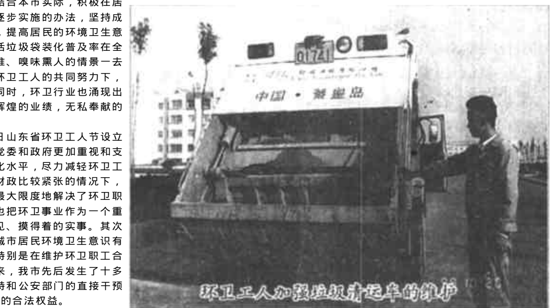
环卫工人加强垃圾清运车的维护

今年10月26日是第五届山东省环卫工人节,全市环卫战线上的广大干部职工欢欣鼓舞,正以饱满的热情迎接自己的节日。他们决心继续发扬“宁愿一人脏,换来万人洁”的“城市美容师”精神,用自己的辛勤的劳动和汗水,让城市的“窗口”更加亮丽。